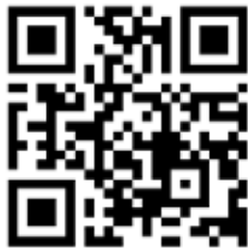
↑交野おりひめ大学HPです。

本来は、写真付きでもっと紹介したいのですが、残念ながら紙面が尽きてしまいました。続きは、大学のホームページをご覧ください！