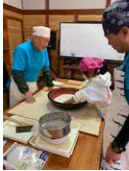
おいしいおそばにな〜れ♪

参加者全員が、真剣な眼差しで取り組んでいる姿が印象的でした。 「これからも、そばを通じて地域に笑顔の輪を広げたいと思います。」