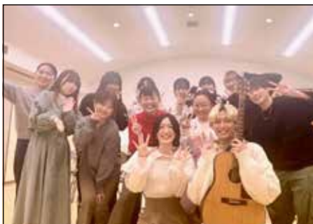
↑シャルマンココのお二人と練習会

コロナ禍で高校生活を過ごした大学生たちが、シャルマンココとコラボする音楽イベント、18再。活動資金調達のためにクラウドファンディングに挑戦したところ、たくさんの方々からご支援をいただき、当初目標額の41万円を大きく上回る65万円を達成することが出来ました。ご支援いただいたみなさんに、この場をお借りして心から御礼申し上げます。18歳イベントは、3月23日(土)正午過ぎから、水辺プラザ周辺で開催します。現在は、シャルマンココさんと当日に向けた練習や、SNSでの広報に励んでいます。当日をお楽しみに！