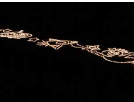
↑昨年の展示。UFOと星のあまんを表現しました。

キャンドルアートで、 思いを伝えたい。 今年も交野おりひめ大学は七夕まつりに参加します! 七夕伝説発祥の地と言われる交野市では、7月になると市内各地で、七夕まつりが行われます。その最後を飾るのが、7月29日に星の里いわふねで開催される「天の川七夕まつり」です。 例年、キャンドルアートで参加させていただいていますが、今年も昨年と同じ