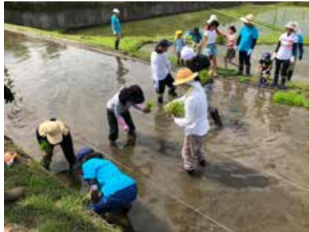
↑酒づくりの会の酒米の田植え

6月4日、酒づくりの会メンバー40人程が、向井田の酒米田で、酒米の田植えを行いました。 今年で8回目となる酒米の田植え。昨年は、苗作りに失敗しましたが、今年は立派な苗が育ちました。 植え方のレクチャーを受けた後、2枚の田んぼに手分けして植えていきます。皆、慣れぬ泥に足を取られつつ、秋の収穫に思いを馳せながら、田植えを楽しみました。順調に育てば、10月中旬に稲刈りを行い、来春には純米吟醸「百天満天」が上槽されます。