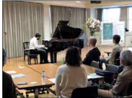
↑すばらしい演奏に聞きほれる学科生たち

アンコールで演奏された童謡「おぼろ月夜」は、お二人の歌声のハーモニーに心の琴線が揺さぶられた、すばらしいものでした。美しい音楽の余韻に浸りながら、2023開講式はお開きに。今年も、交野を元気にする活動に向け、一同心新たにした開講式でした。