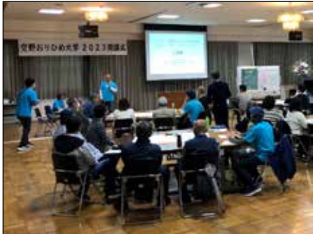
↑たくさんの学科生が参加した開講式

引き続き行なわれたワークショップでは、参加者を7つのチームに分け、「つくってみたいこんな学科」をテーマに、グループ討論を実施。チームごとに取りまとめた意見は、チームの