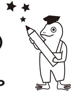
大学マスコットのカエルくん「交野にカエル、交野をカエル」

業に合わせて実施するなど、各学科の特色をうまく出しつつ行なわれました。新たな学科生も多く加入され、新旧学科生が今年度の活動を期待に胸を膨らませながら、開講式に臨まれました。